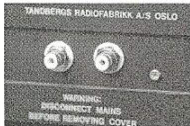
Liten modifikasjon med stor betydning.